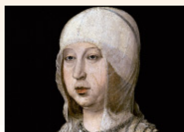
Don Carlos de España (1545-1568)

Tras la presencia de cartagineses (s. III a.C.), romanos (III a.C.-V d.C.), visigodos (V-VIII) y musulmanes (desde el VIII), se emprendió la reconquista que culminó con los Reyes Católicos y la unión de España (finales del XV). En el XIX se promulgó la primera constitución y un siglo después se proclamó la república, a la que sucedió la guerra civil, la dictadura de Franco y la democracia.